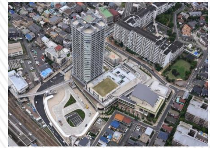
マークタワー長津田 (平成24年竣工)

横浜市住宅供給公社は、駅前再開発事業や区画整理事業等に取り組み、良質な住宅の供給を行っております。また、分譲および賃貸住宅の管理や市営住宅の募集・管理などを実施しており、横浜市の住宅施策やまちづくりに取り組んでおります。近年では、再開発で培った技術を活かし、マンションや団地の再生に関するコンサルティングに力を入れております。