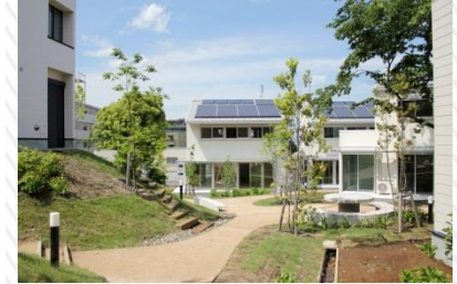
MINA GARDEN 十日市場 (平成24年竣工)